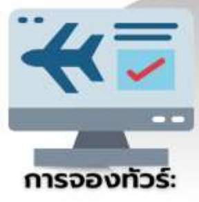
การจองทัวร์: