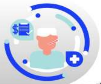
กรณีเจ็บป่วย:

กรณีเจ็บป่วยจนไม่สามารถเดินทางได้ ต้องมีใบรับรองแพทย์จากโรงพยาบาล บริษัทฯ จะทำการเลื่อนการเดินทางของท่านไปยังคณะต่อไป ทั้งนี้ ท่านจะต้องเสียค่าใช้จ่ายที่ไม่สามารถยกเลิก หรือเลื่อนการเดินทางได้ตามความเป็นจริง