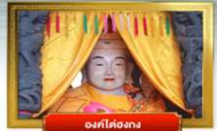
องค์กรโตงกง