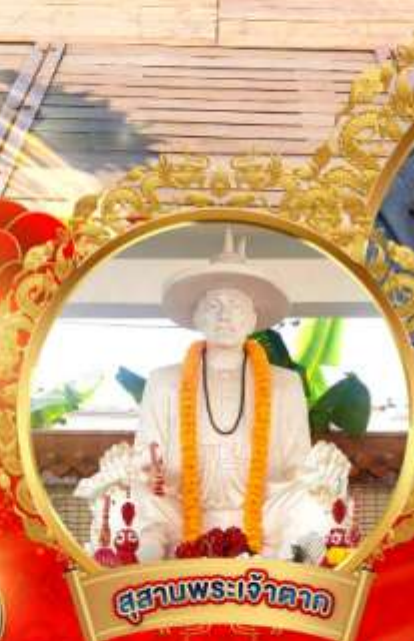
อุทยานพระเจ้าตาก