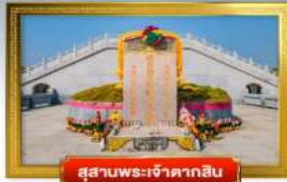
สุสานพระเจ้าตากสิน