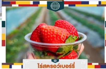
ไร่สตอว์เบอร์รี่