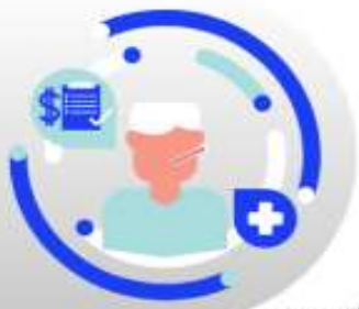
กรณีเจ็บป่วย:

กรณีเจ็บป่วยจนไม่สามารถเดินทางได้ ต้องมีใบรับรองแพทย์จากโรงพยาบาล บริษัทฯ จะทำการเลื่อนการเดินทางของท่านไปยังคณะต่อไป ทั้งนี้ ท่านจะต้องเสียค่าใช้จ่ายที่ไม่สามารถยกเลิก หรือเลื่อนการเดินทางได้ตามความเป็นจริง