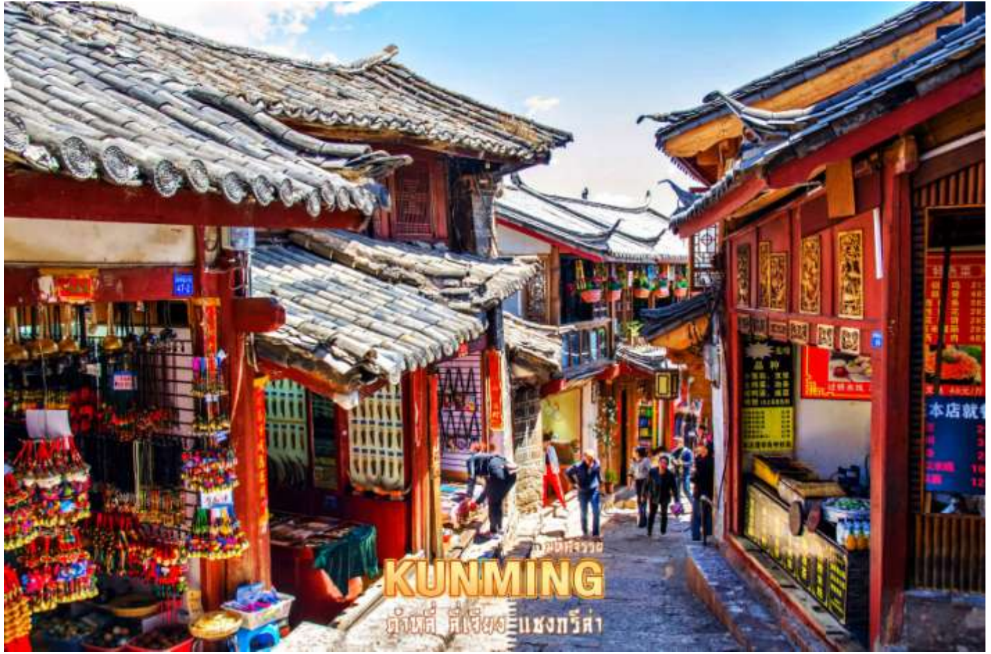
KUNMING ดงผีเสื้อ เชียงใหม่

อุทยาน ”โดยมีบ้านสามหลังหันเข้าหากันและมีลานบ้านอยู่ตรงกลางและจะปลูกดอกไม้ในลานเล็กๆ มีสภาพแวดล้อมที่เงียบสงบและเรียบง่าย จึงสร้างความผ่อนคลายให้กับนักท่องเที่ยว