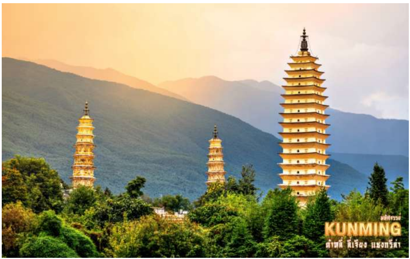
เมืองกุ๊วหมิง KUNMING ต่ำที่ คีเจียง แหงกวี่ต้า

นำท่านสักการะ วัดเจ้าแม่กวนอิมแปลงกาย ตามตำนานเล่าว่าเจ้าแม่กวนอิมได้แปลงกายโดยแบกก้อนหินใหญ่ไว้ข้างหลังเพื่อขวางทางทหารมิให้รุกรานเข้าเมืองได้ชาวเมืองจึงสร้างวัดแห่งนี้ขึ้นในราชวงศ์ถังนับเป็นวัดที่มีประติมากรรมเยี่ยมยอดแห่งหนึ่ง