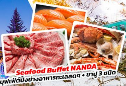
Seafood Buffet NANDA บุฟเฟต์บึงย่างอาหารทะเลสดๆ + ซาซึมิ 3 ชนิด