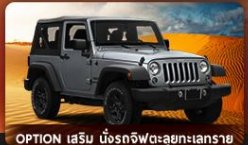
OPTION เสริม นั่งรถจี๊ปตะลุยทะเลทราย