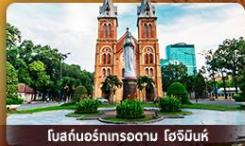
โบสถ์นอร์ทเทรอดาม โฮจิมินห์