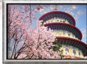
วัดอูจี้ เกียนหยวน