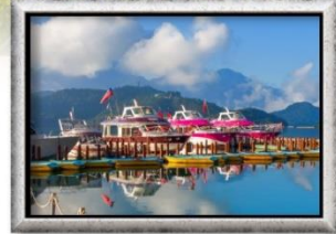
ทะเลสาบสุริยันจันทรา

พิเศษ! เมนูบุฟเฟ่ต์ชาบูหม้อไฟไต้หวัน, เสี่ยวหลงเปา