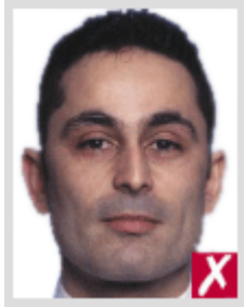
ไกลเกินไป