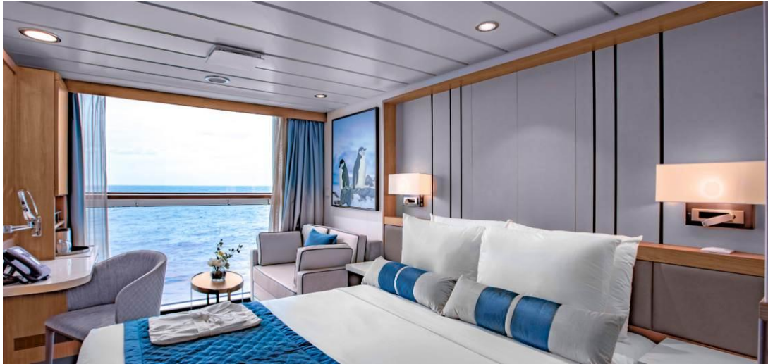
4) ห้องพักแบบ Tripple Cabin (พัก 3 ท่านต่อห้อง) – Cat F ห้องชั้น 3 ขนาด 22 ตร.ม.