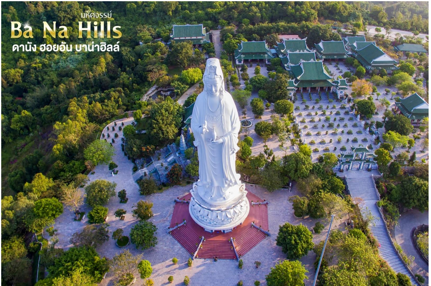
มหัศจรรย์ Ba Na Hills ดานัง ฮอยอัน บาน่าฮิลล์

ออกไปหาปลา นอกชายฝั่งวัดแห่งนี้นอกจากเป็นสถานที่ศักดิ์สิทธิ์ที่ชาวบ้านมากราบไหว้บูชาและขอพรแล้วยังเป็นอีกหนึ่งสถานที่ท่องเที่ยวที่สวยงามเป็นอีกหนึ่งจุดชมวิวที่สวยงามของเมือง ดานัง