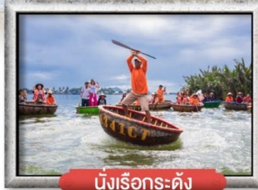
นิงเรือกระดิง