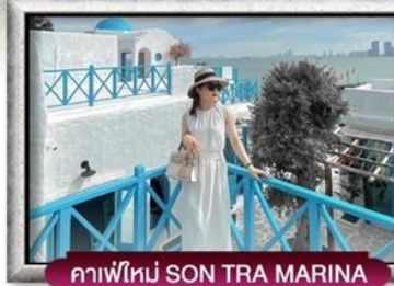
คาเฟ่ใหม่ SON TRA MARINA