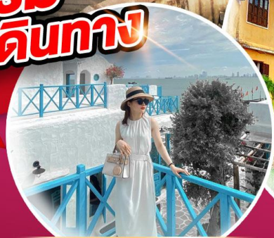
คาเฟ่ใหม่ SON TRA MARINA