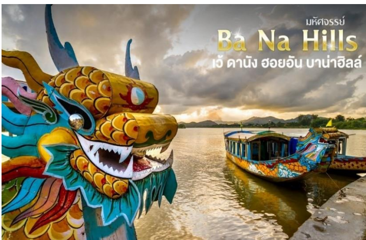
มหัศจรรย์ Ba Na Hills เว้ ดานัง ฮอยอัน บาน่าฮิลล์

นำท่าน ลงเรือมังกรล่องแม่น้ำหอม พร้อมชมการแสดงและดนตรีพื้นเมือง