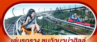
เล่นรถราง ชมวิวบานาฮิลล์