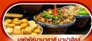
บุฟเฟ่ต์นานาชาติ บานาฮิลล์

พักผ่อน บานาฮิลล์ 1 คืน นั่งกระเช้าที่ยาวที่สุดในโลก ขึ้นสู่บานาฮิลล์ ชมเมือง ฮอยอัน เมืองมรดกโลกที่สวยงามและเจียบสงบ พิเศษ!! บุฟเฟ่ต์นานาชาติ บานาฮิลล์