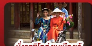
นั่งรถชิโคลาส ชมเมืองเว้