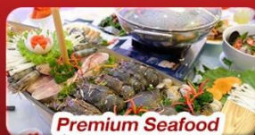
Premium Seafood Hotpot Boatget

นั่งกระเช้าที่ยาวที่สุดในโลก ขึ้นสู่บาน่าฮิลล์ ชมเมือง ฮอยอัน เมืองมรดกโลกที่สวยงามและเจียมสงบ พิเศษ!! บุฟเฟ่ต์นานาชาติ บาน่าฮิลล์ และ Seafood