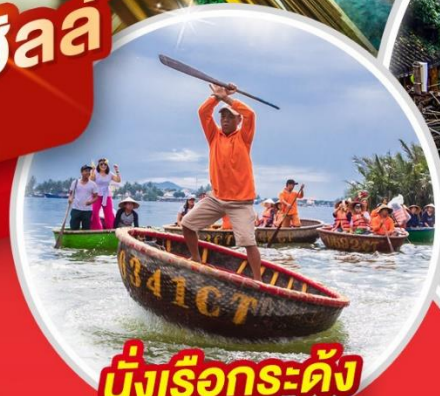
นั่งเรือกระด้ง Hoi An