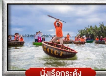
นั้งเรือกระดั้ง