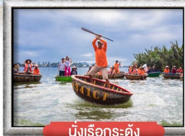
นิงเรือกระด้ง