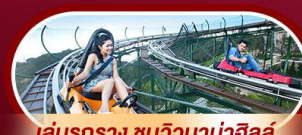
เล่นรอกาง ชมวิวบานาฮิลล์