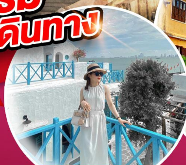
คาเฟ่ใหม่ SON TRA MARINA