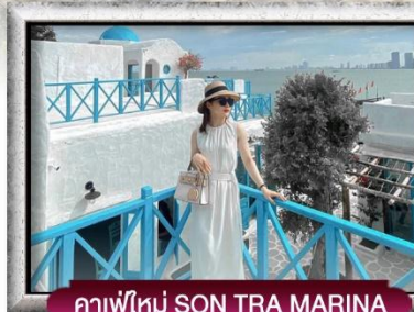
คาเฟ่ใหม่ SON TRA MARINA