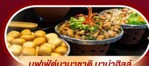
บุฟเฟ่ต์นานาชาติ บานาฮิลล์

พักผ่อน บานาฮิลล์ 1 คืน นั่งกระเช้าที่ยาวที่สุดในโลก ขึ้นสู่บานาฮิลล์ ชมเมือง ฮอยอัน เมืองมรดกโลกที่สวยงามและเจียบสงบ พิเศษ!! บุฟเฟ่ต์นานาชาติ บานาฮิลล์