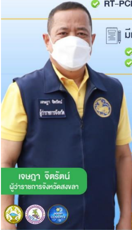
เจษฎา จิตรัตน์ ผู้ว่าราชการจังหวัดสงขลา

✓ RT-PCR หรือ Antigen Test Kit (Atk) ซึ่งรับรองโดยบุคลากรทางการแพทย์