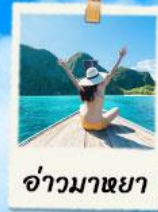
อ่าวมาหยา