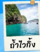
ถ้ำไวกิ้ง