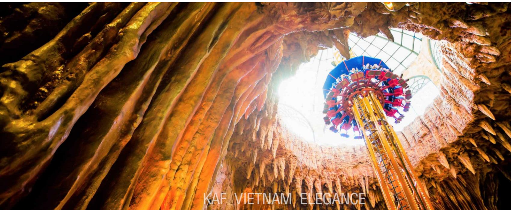
KAF VIETNAM ELEGANCE

-เลือกเฉพาะพักเดี่ยวบนบานาฮิลล์ 1คืน เพิ่ม 2,000 บาทต่อท่าน