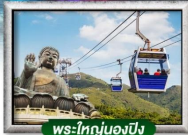
พระใหญ่นองปิง