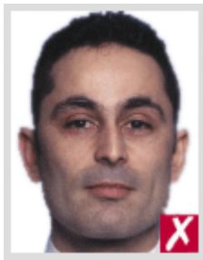
โก่งเกินไป