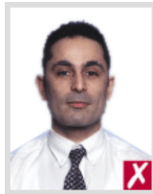
โก่งเกินไป