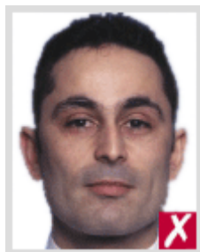
ใกล้เกินไป