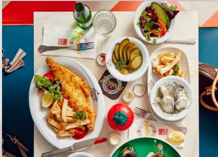
Fish and Chip