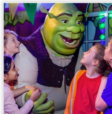
Shrek's Adventure ราคา GBP 21