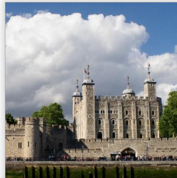
Tower of London ราคา GBP 27.50