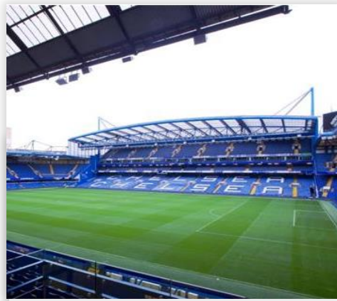
Chelsea FC Stadium