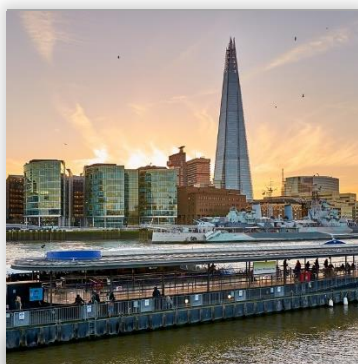
View from the shard ราคา GBP 27