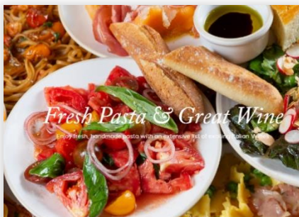
Flour & Grape