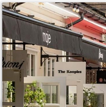
Bicester Village ราคา GBP 28