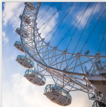
London Eye ราคา GBP 27