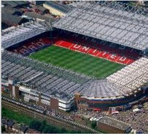
Old Trafford Stadium