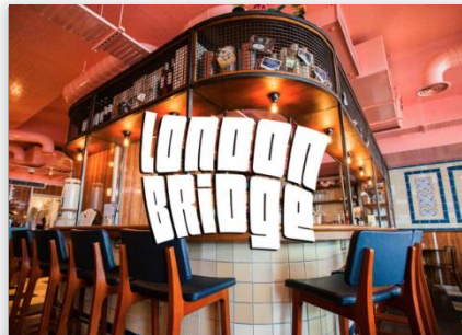
The Breakfast Club