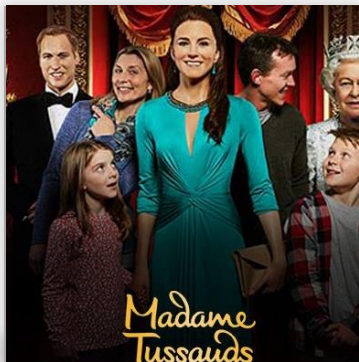
Madam Tussauds ราคา GBP 32