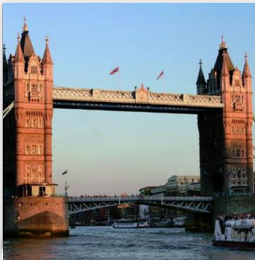
City Cruise ราคา GBP 10.50