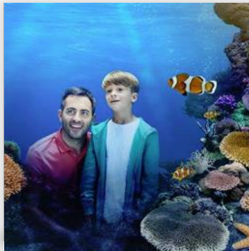
Sea Life Aquarium ราคา GBP 34.20