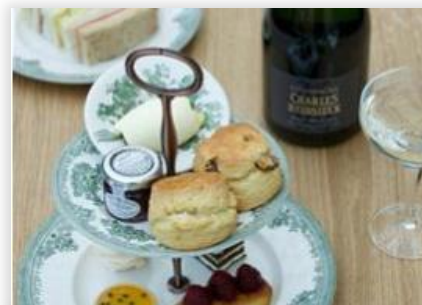
Afternoon Tea at The British Museum

สถานที่ : ร้านอาหาร Great Court, British