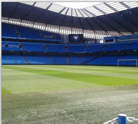
Man City Stadium