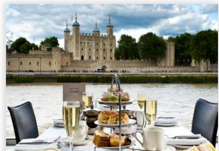
Superior Afternoon Tea