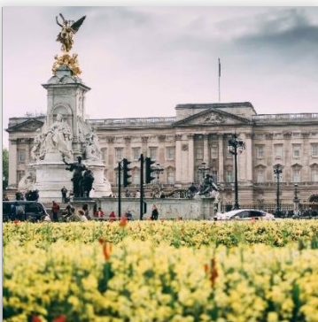
Buchingham Palace ราคา GBP 25