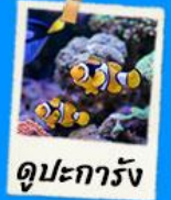
ดูปะการัง