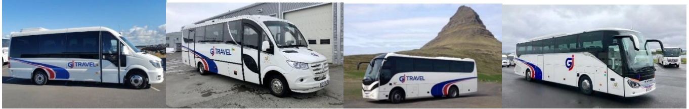
10 ท่านใช้รถ 19 ที่นั่ง