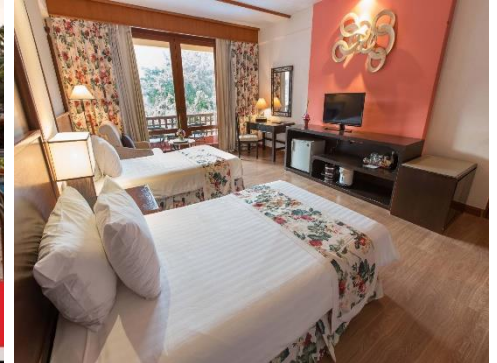
บรรยากาศอบอุ่น มีภูเขาโอบล้อม