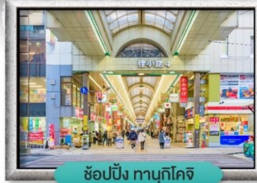
ช้อปปิ้ง ทานุกิโคจิ