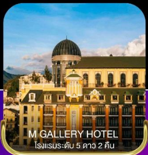
M GALLERY HOTEL โรงแรมระดับ 5 ดาว 2 คืน