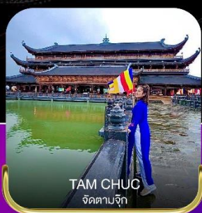
TAM CHUC วัดตามจึก