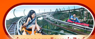
เล่นรถราง ชมวิวบานาฮิลล์

นั่งกระเช้าที่ยาวที่สุดในโลก ขึ้นสู่บานาฮิลล์ ฮอยอัน เมืองมรดกโลกที่สวยงามและเจียบสงบ