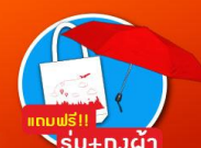
แถมฟรี!! ร่ม+ถุงผ้า