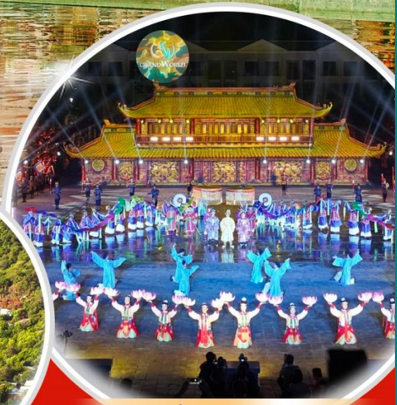
ชมโชว์ที่ Grand World