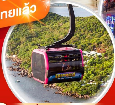
นั่งกระเช้าไฟฟ้า