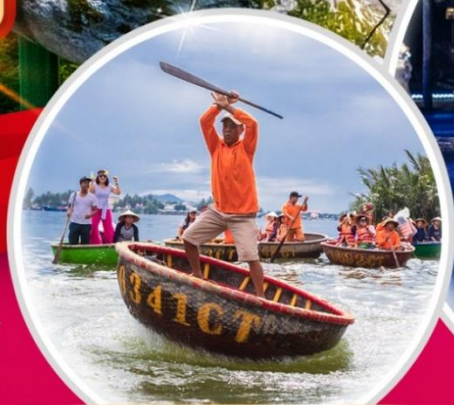
นั่งเรือกระดิง Hoi an