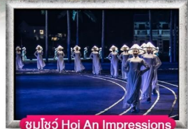
ชมโชว์ Hoi An Impressions

เมนู สุดพิเศษ Premium Seafood, Buffet Bana Hills