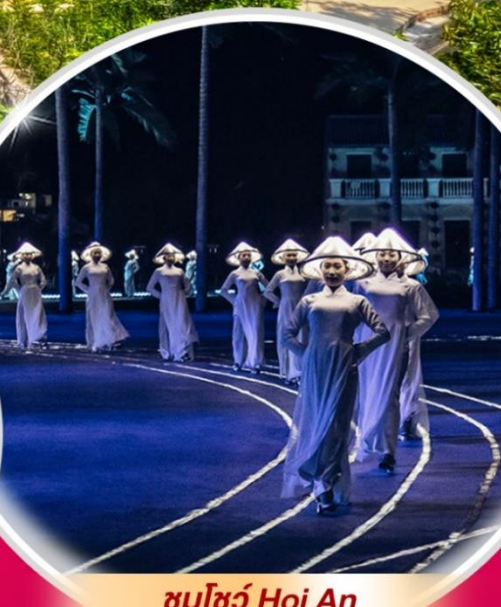
ชมโชว์ Hoi An Impressions Theme Park