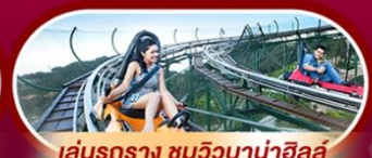
เล่นรถไฟเหาะ บานาฮิลล์