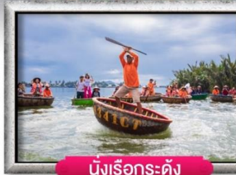
นิงเรือกระดิง