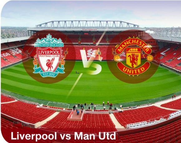
Liverpool vs Man Utd