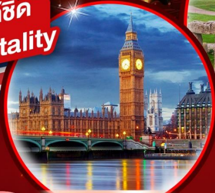
หอนาฬิกา Big Ben