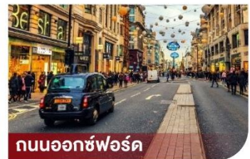
ถนนออกซ์ฟอร์ด