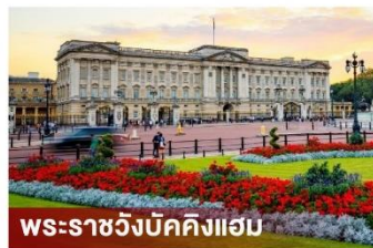
พระราชวังบักกิงแฮม