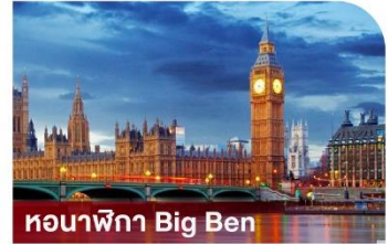
หอนาฬิกา Big Ben