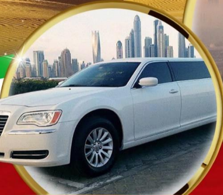
นั่งรถสี่ล้อสุดหรู