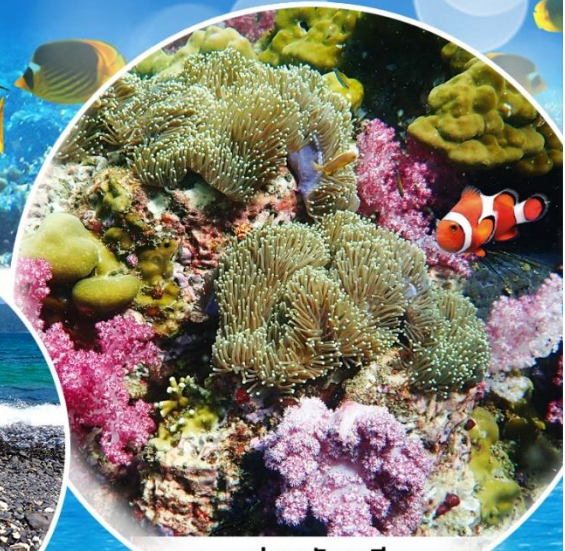
ปะการัง 7 สี