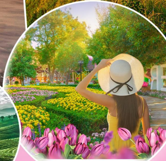
เทศกาลดอกไม้งาม