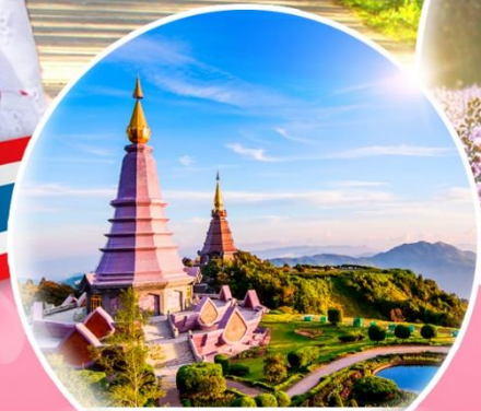
วัดพระมหาธาตุนภเมทนีดล