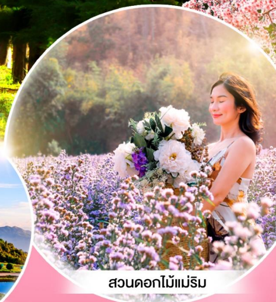
สวนดอกไม้แม่ริม