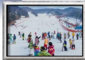
ลานสกีขนาดใหญ่

✓ เล่นสกีเต็มอิ่ม ซิปป์ฮ้างที่ใหญ่ที่สุดในเกาหลี