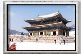
พระราชวังเคียงบกุง

พิเศษ!! ซิมสตรอว์เบอร์รี่สดๆ จากไร่ BBQปิ้งย่างเกาหลี