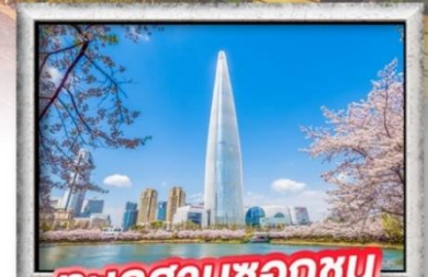
ทะเลสาบชอกซอน