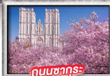
ถนนซากุระ ม.คยองฮี