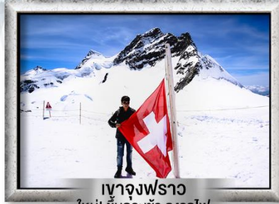
เขาจุงเฟราว ใหม่! ขึ้นกระเช้า ลงรถไฟ