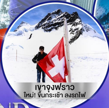
เขาจุงเฟราว ใหม่! ขึ้นกระเช้า ลงรถไฟ