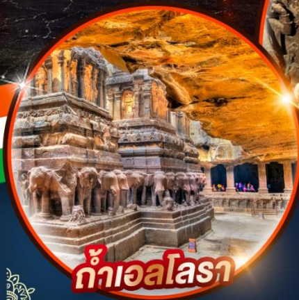
ถ้ำเอลโลรา