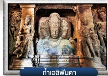
ถ้ำเอลิฟินตา