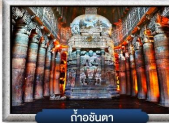
ถ้ำชันตา

✓ ชมนครแห่งตำนานเกาะในทะเล "ถ้ำเอลิฟินตา"