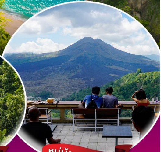
หมู่บ้านคินตามณี