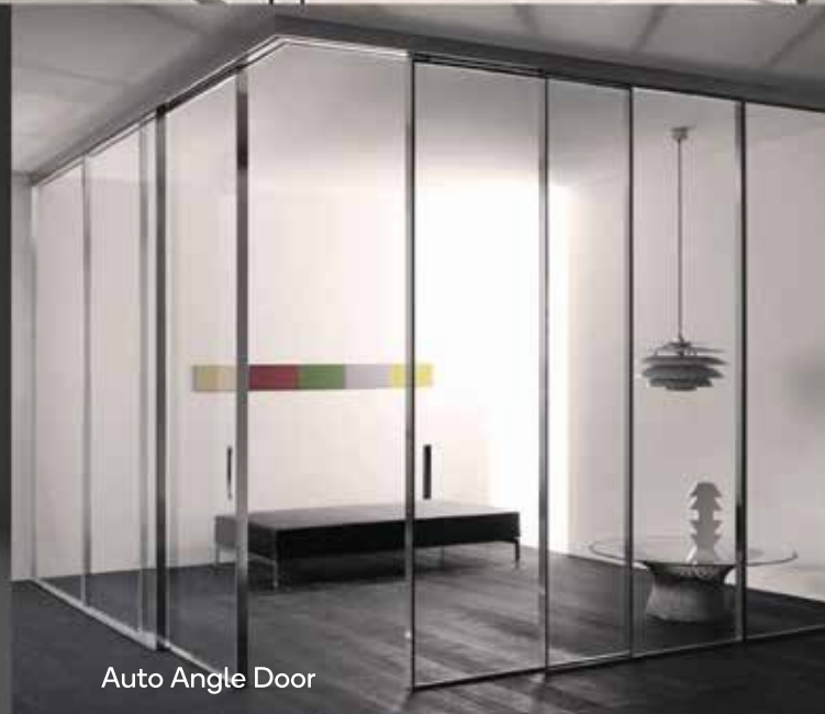
Auto Angle Door