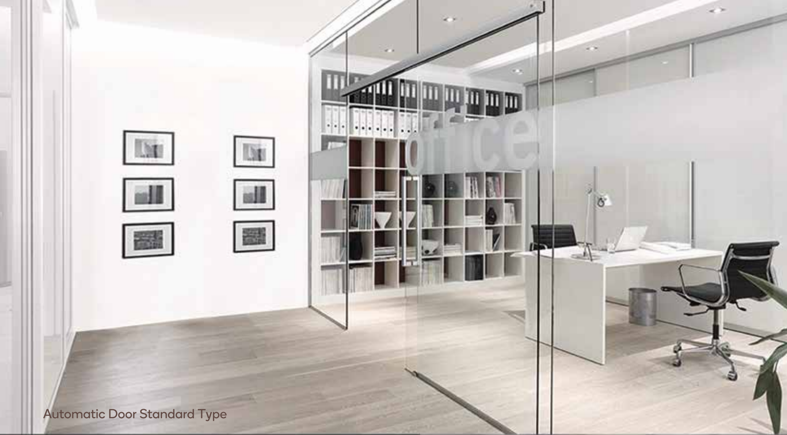
Automatic Door Standard Type