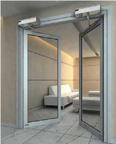
Automatic Swing Door