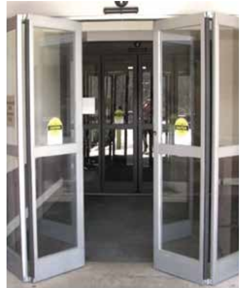
Automatic Folding Door

และรวมถึง Curved Door, Airtight Sliding Door, Telescopic Sliding Door, Revolving Door, Auto Angle Door & Auto Escape Door