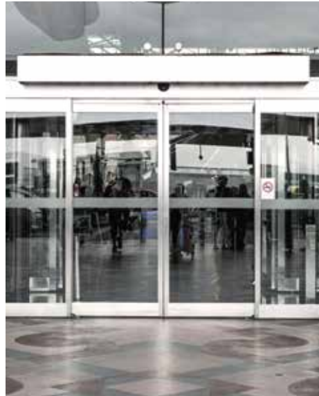
Automatic Sliding Door