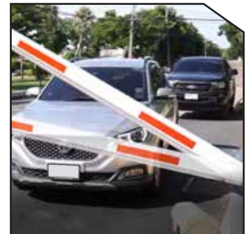
Barrier gate swing out and auto-reverse on obstacle, Protect barrier gate and car.