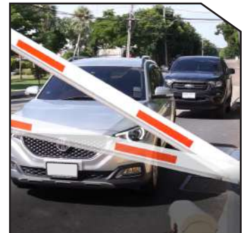
Barrier gate swing out and auto-reverse on obstacle, Protect barrier gate and car.