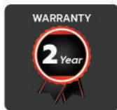
รับประกัน 2 ปี