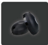
เซนเซอร์กันหนีบ