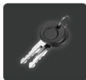
กุญแจปลดล็อค