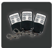
กุญแจรีโมท