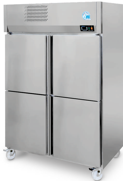
Model : KTUP-1324D