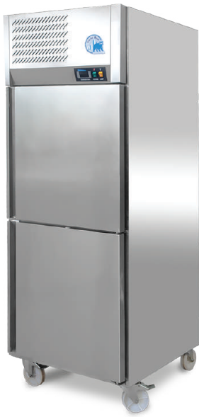
Model : KTUP-6820D