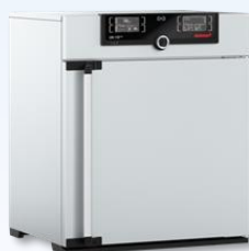
Hot Air Oven