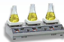
Hot Plate & Magnetic Stirrer