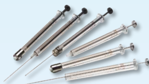
GC HPLC Syringe