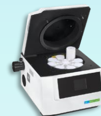
Microwave Sample Preparation