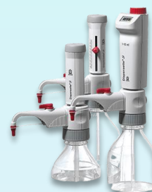
Dispensette Bottle-top Dispenser