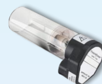
Hollow Cathode lamp