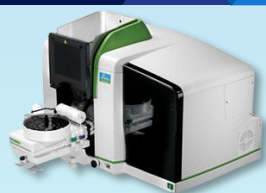
Atomic Absorption Spectrometer (AAS)