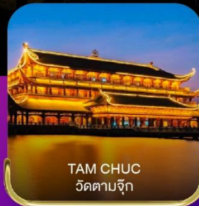
TAM CHUC วัดตามจุก