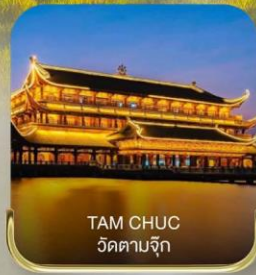
TAM CHUC วัดตามจุก

Premium Program เหมาลำ พีเรียมวันหยุดปีใหม่ | 5 วัน 3 คืน