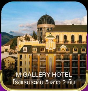
M GALLERY HOTEL โรงแรมระดับ 5 ดาว 2 คืน