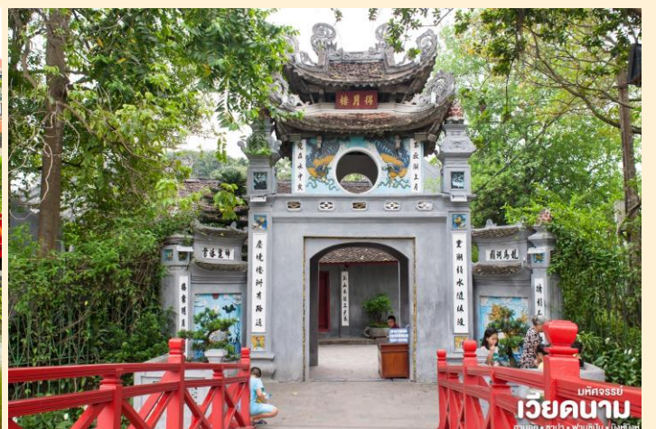
มหิตจรรย์ เวียงคานาม ฮานอย • ซาปา • ฟานซิงห์ • นิงห์ฮิ่งห์