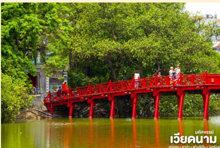
มหิตจรรย์ เวียงคานาม ฮานอย • ซาปา • ฟานซิงห์ • นิงห์ฮิ่งห์