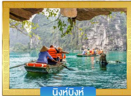
นิงห์บิงห์