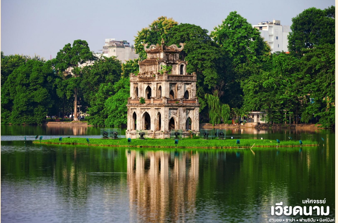
มหิตจรรย์ เวียงคานาม ฮานอย • ซาปา • ฟานซิงห์ • นิงห์ฮิ่งห์