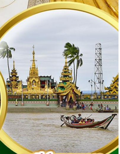
เจดีย์เยลพญา