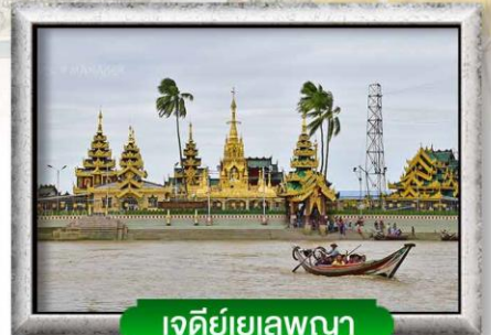
เจดีย์ยเลพญา